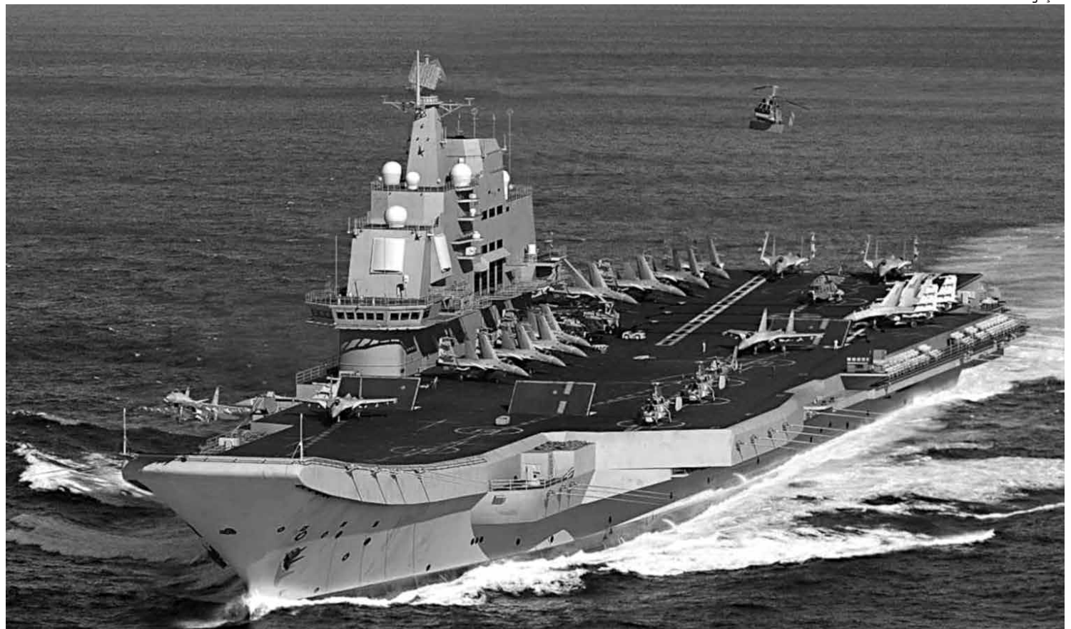
O porta-aviões Liaoning foi deslocado pela primeira vez para uma base militar no Mar da China Meridional, onde há uma disputa territorial

Vários casos de assassinato são relacionados ao trabalho investigativo de jornalistas sobre cartéis de drogas mexicanos e colombianos, que atuam na produção e distribuição.