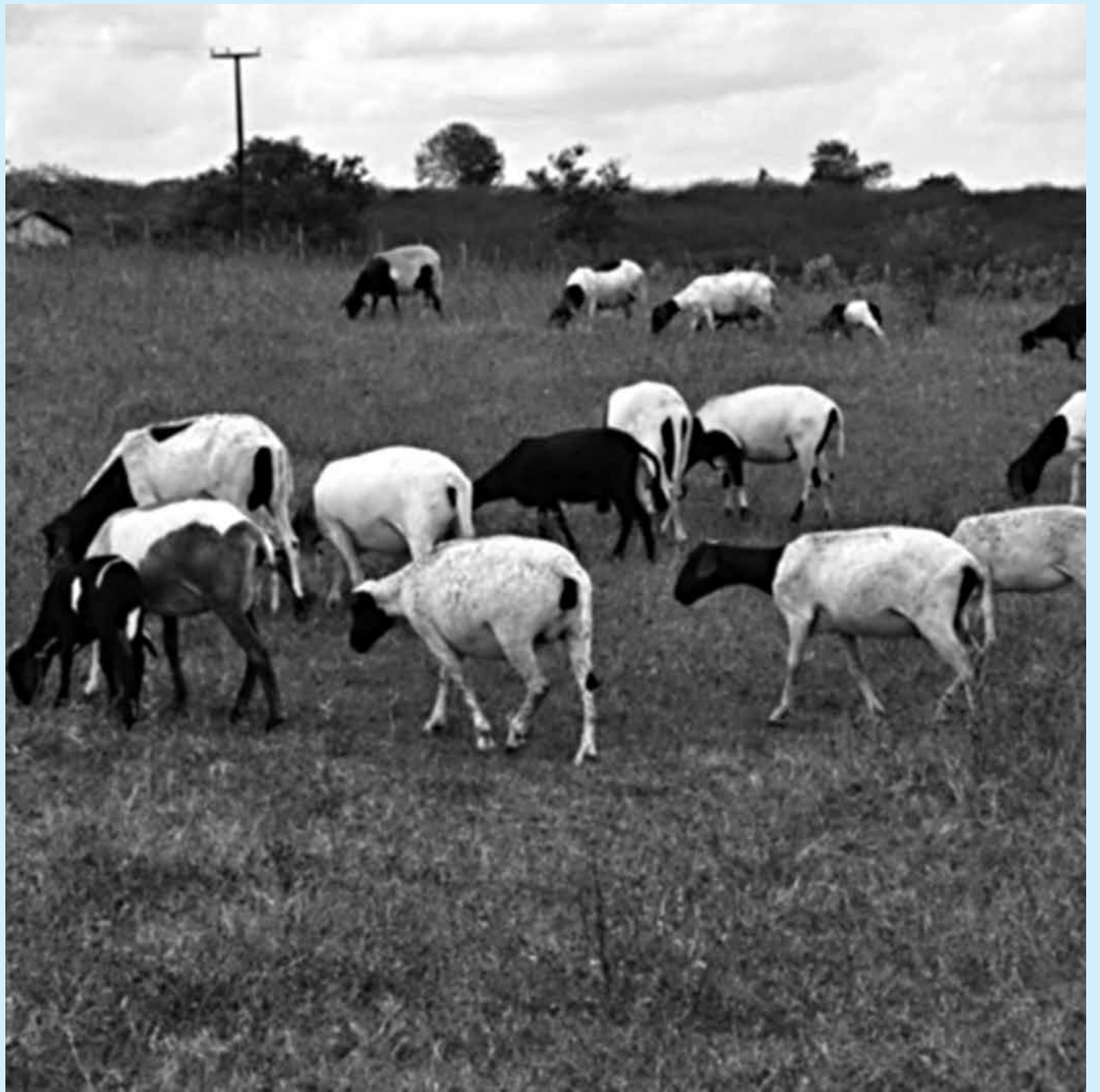
Caprinocultura será tema de seminário que tem como objetivo capacitar criadores para aumentar a produção da bacia leiteira

O projeto é uma iniciativa do Governo do Estado com a finalidade de impulsionar e dinamizar a agricultura nessa região. A infraestrutura é composta por um canal de 37 km de extensão, onde há túneis, sifões e galerias. Compõem ainda o projeto um reservatório de compensação, estação de bombeamento, subestação elétrica, adutoras, reservatório de distribuição, rede de drenagem, rede viária, cercas do perímetro, reserva legal e centro gerencial.