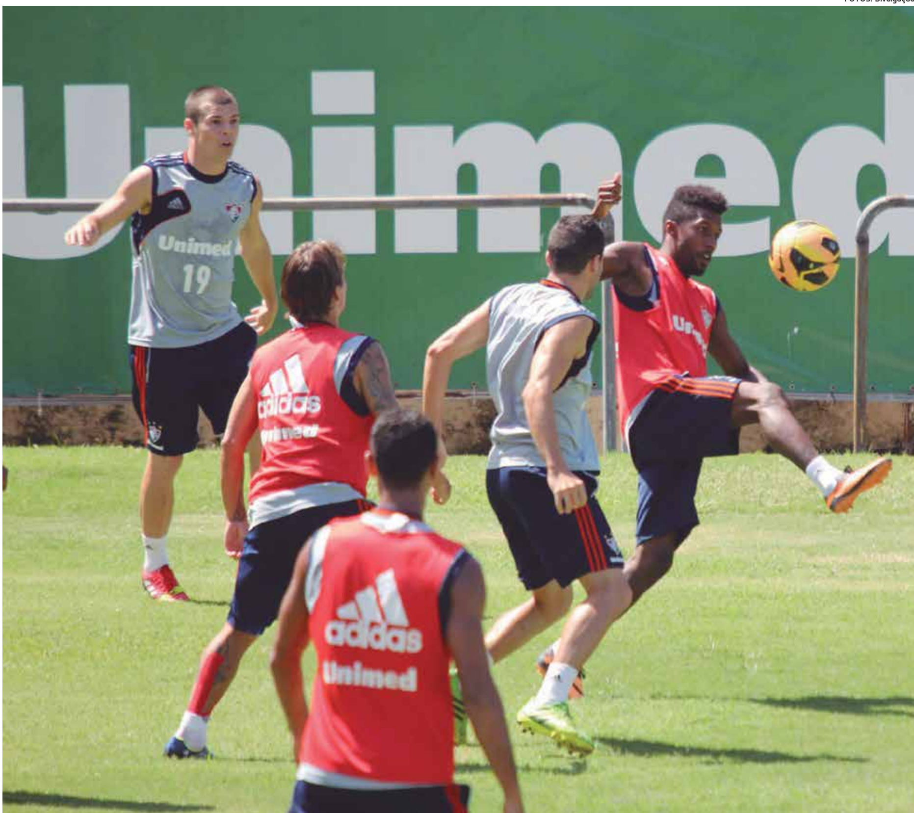
Jogadores treinaram com muita desenvoltura, ontem pela manhã, nas Laranjeiras para o jogo de hoje contra o Atlético Mineiro, onde somente a vitória interessa ao Fluminense

Uma vitória sobre o Timão livra a equipe matematicamente do risco de rebaixamento. Com 46 pontos e em 12º lugar, o Colorado está quatro pontos à frente da zona de descenso. Uma derrota poderá fazer a equipe ficar a um pontinho do abismo na última rodada da competição.