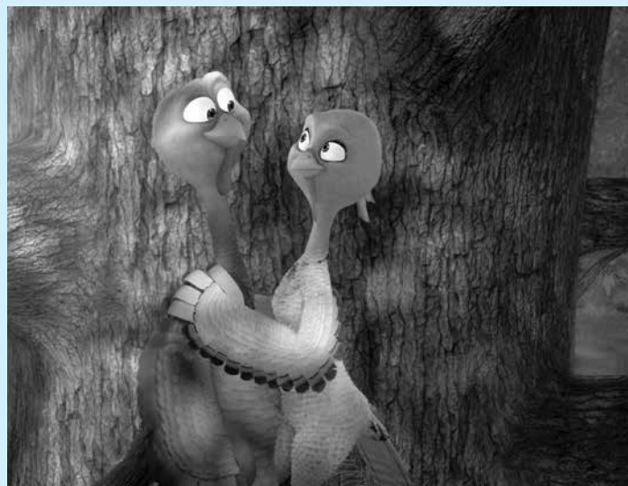
Animação é uma comédia protagonizada por perus