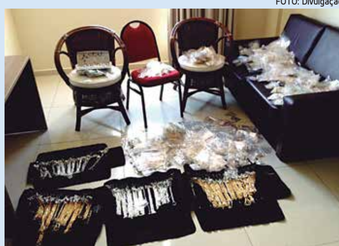
As mercadorias apreendidas foram avaliadas em R$ 100 mil

Durante as investigações, o setor de inte-