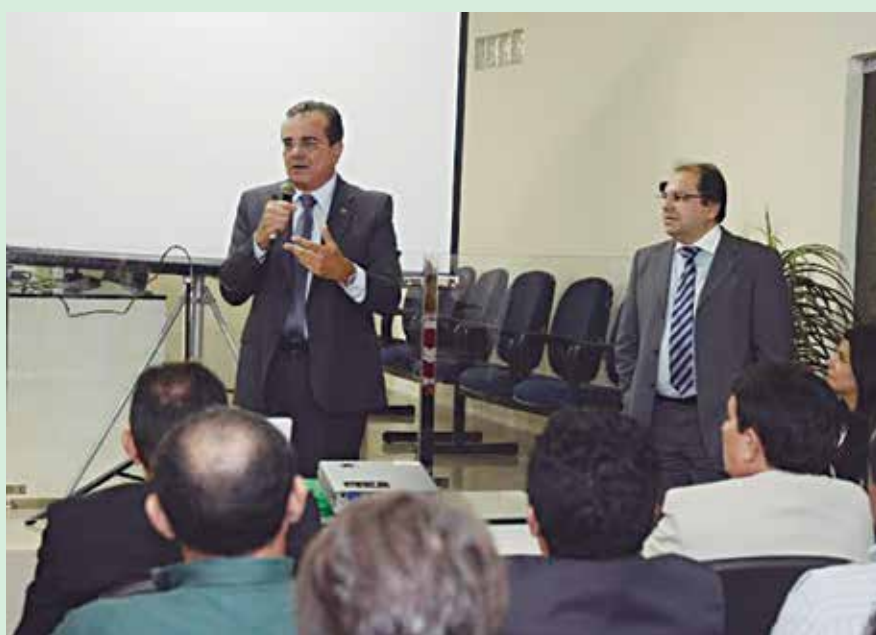
O TRE-PB vai reunir juizes, servidores e lideranças partidárias do Alto Sertão

A metodologia segue a dos encontros anteriormente realizados em Patos e Guarabira,