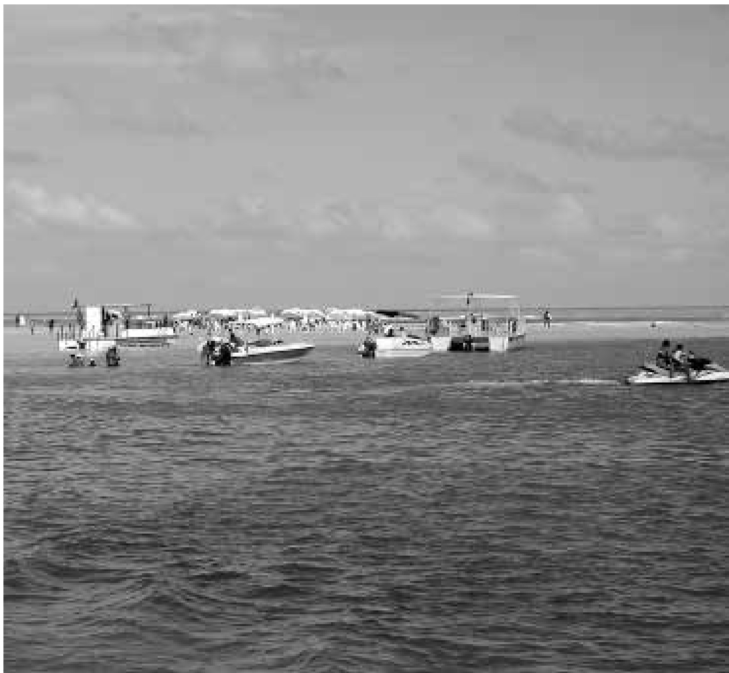
O patrulhamento policial também será intensificado no Parque de Areia Vermelha, cujo objetivo é fiscalizar o uso indevido do local

O comandante Abrantes disse que todas as equipes da Capitania dos Portos estarão equipadas com etilômetro (bafômetro). As embarcações à vela ou remo devem manter 100 metros de distância das praias, e as equipadas com motor, 200 metros.