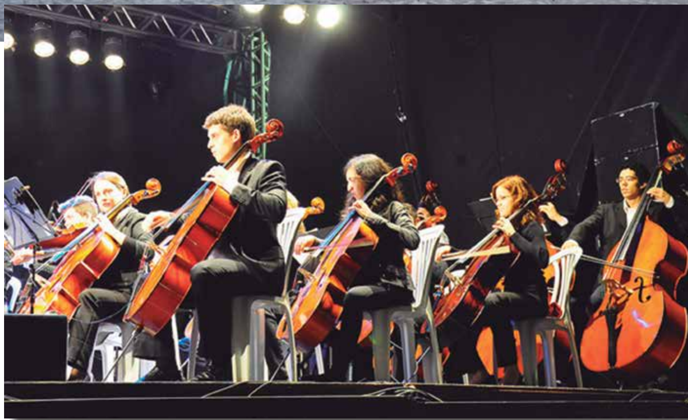
O Teatro Severino Cabral, inaugurado em 1963, recebeu shows de vários artistas e hoje será palco para concerto da Orquestra Sinfônica Jovem

espetáculos. Por isso nos preparamos musicalmente para este evento. Almejamos que outras oportunidades surjam", espera o maestro.