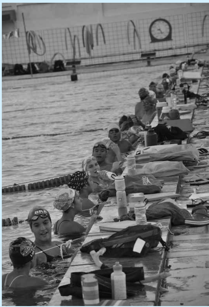
Atletas do Grêmio Cief vão participar da competição no Sesi

À tarde começa às 14h30 com os 50m borboleta masculino e termina também com o revezamento.